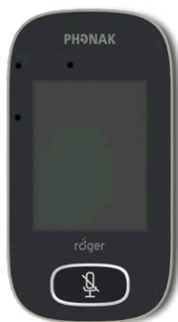
Roger Touchscreen Mic